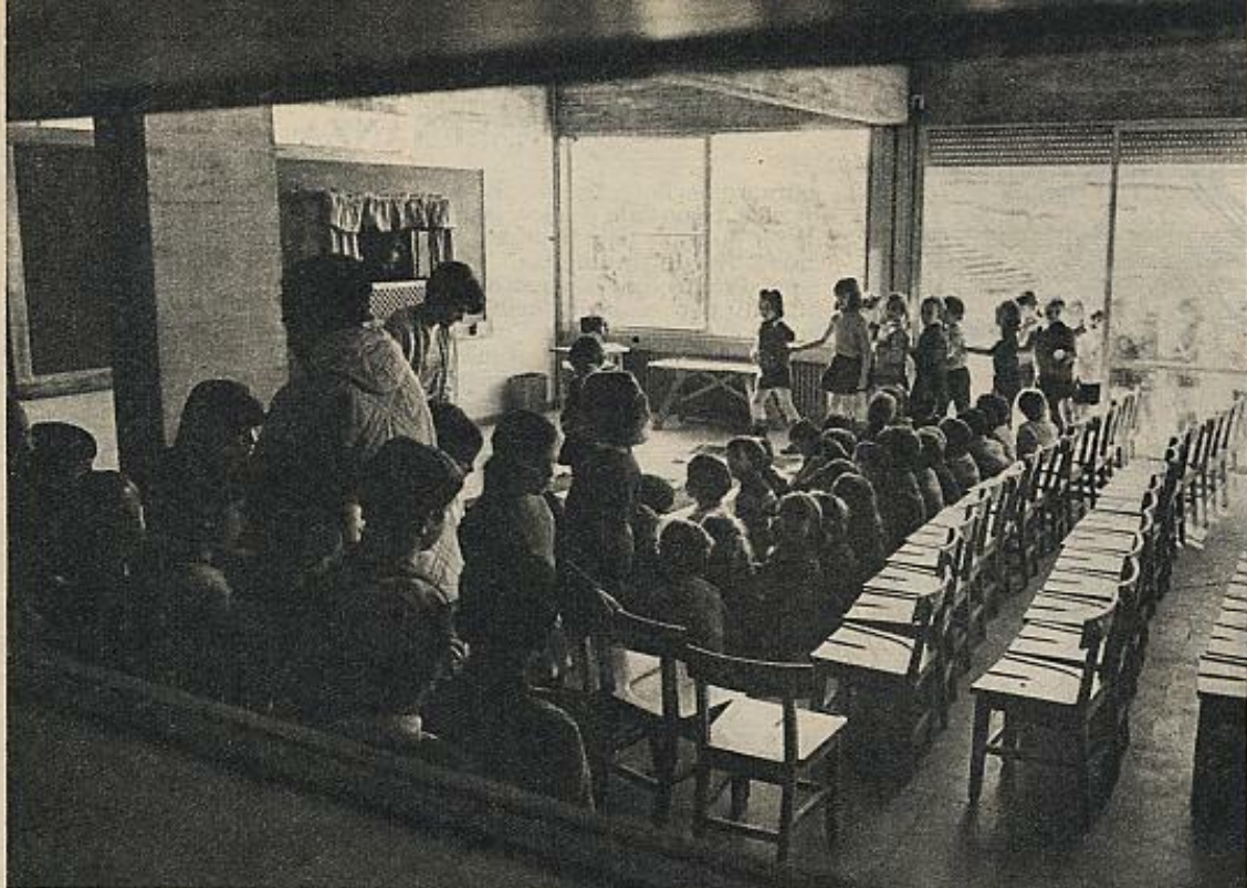
Todos los datos indican el absoluto abandono en que tiene el Estado a la enseñanza preescolar y la escasez abrumadora de plazas disponibles.

posibilidades de reacción racional frente a los acontecimientos (1).