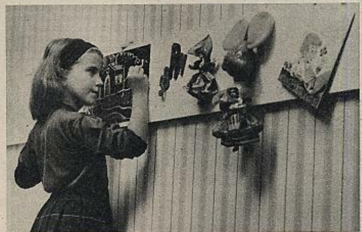
Dadas las nuevas tendencias de la natalidad, el niño pequeño no tiene muchas veces hermanos de su edad con quien jugar, y esta falta de contacto con otros niños dificulta el desarrollo de su sentido de solidaridad y cooperación.

La socialización del cuidado de los niños no supondría la destrucción de nada, porque todo o casi todo ha sido destruido ya. Un sistema de educación preescolar en el que las técnicas pedagógicas se utilicen para la educación de individuos racionales y libres, no estaría en contra de ningún humanismo conocido. Pero contribuiría al surgimiento de personalidades autónomas capaces de enfrentarse a las presiones totalitarias y mejoraría realmente la igualdad de oportunidades educativas. ■ M. V. A. y M. J. M.