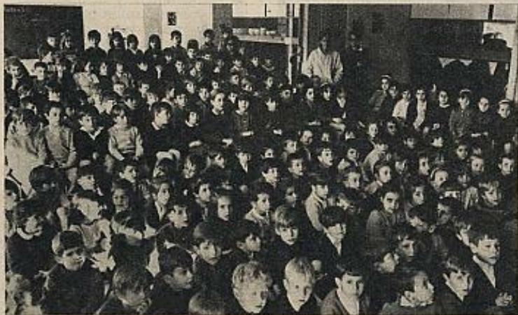
Los niños educados en centros preescolares tenderán a ser más activos, autónomos, críticos y cooperativos que los que han crecido en casa.

las etapas por las que han de pasar para llegar a ser adultos equilibrados, tienen que darse lo que los psicólogos llaman las condiciones necesarias. Básicamente, según las corrientes más avanzadas, es el medio ambiente el que estimula el desarrollo: "los estímulos son esenciales